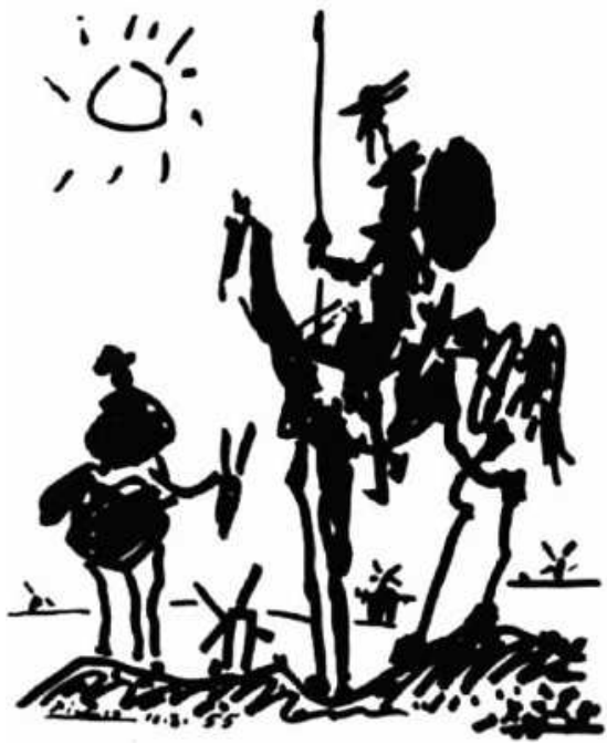
Miguel de Cervantes Saavedra: Don Quijote (ilustracija)